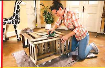
Bosch Weltweit behauptet