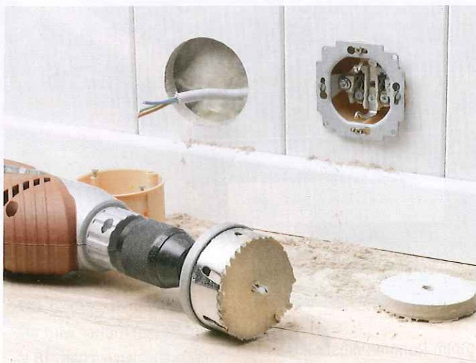
Bis zu 30 Prozent schnelleres Arbeiten mit akkubetriebenen Maschinen: Über Spannuten wird das Sägemehl deutlich schneller abtransportiert.

An der Farbgebung der gebläuten Blätter kann der Anwender die verwendete Materialart erkennen. Bei einem Bi-Metall-Blatt beispielsweise verfärben sich die Zahnschneiden aus HSS-Stahl anders als das Trägermaterial. ■