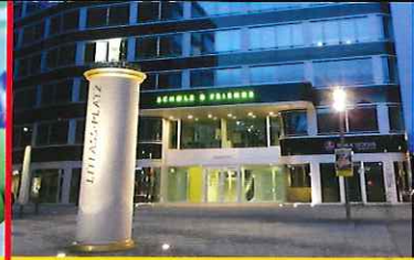
Weber-Stephen Weltpremiere in Berlin