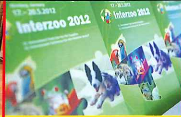
Interzoo Alles für die Heimtierabteilung